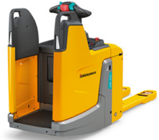
ERE 120/ 125/ 225/ 230