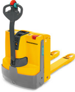
EJE 114/ 116/ 118/ 120