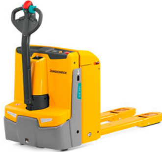
EJE 222/ 225/ 230/ 235